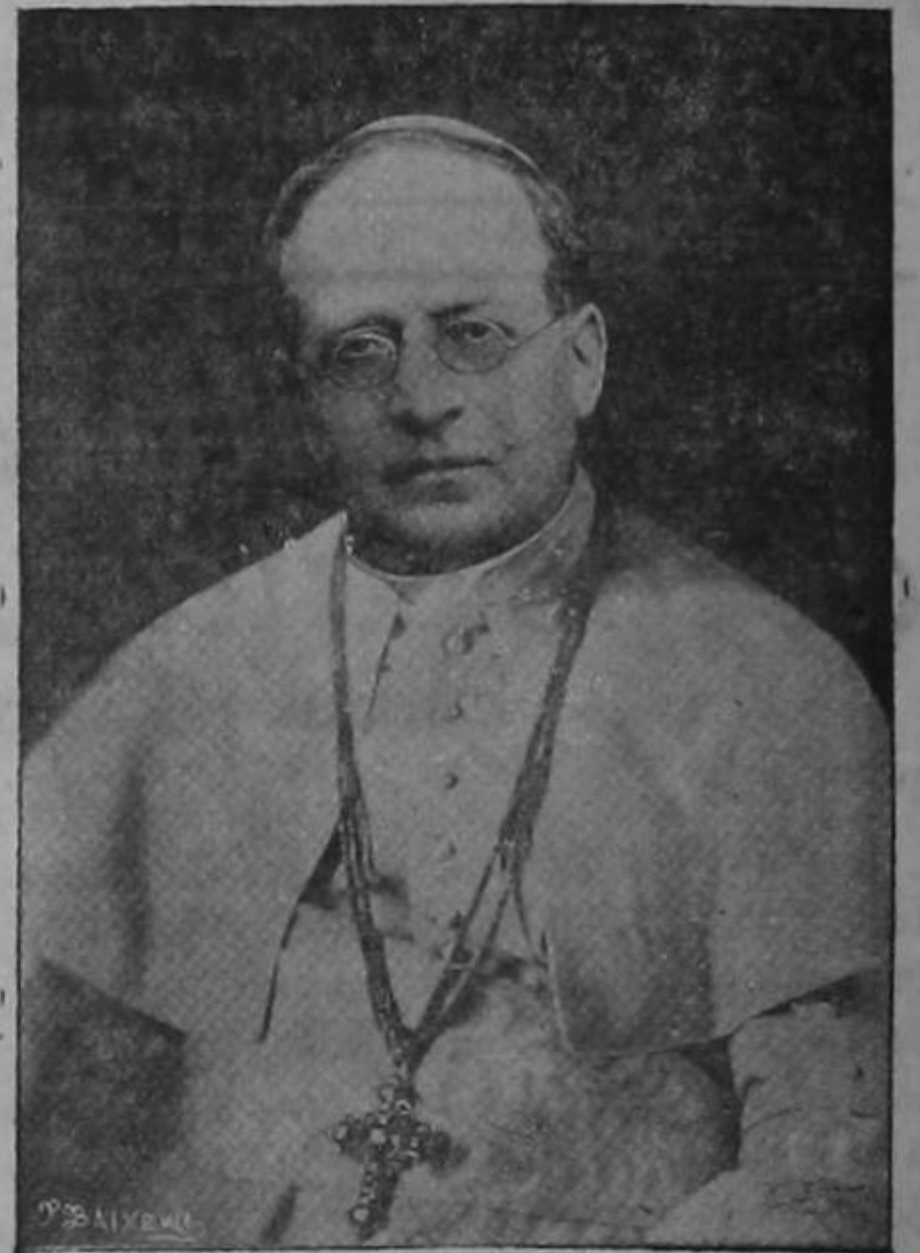
SU SANTIDAD PIO XI

Es el único poder indestructible que transmitido de Pedro hasta Pío XI, subsiste en toda su